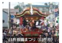
白杵祇園まつり (白杵市)