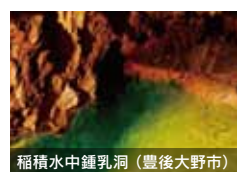
稲積水中鍾乳洞 (豊後大野市)