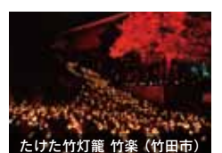
たけた竹灯籠 竹楽 (竹田市)