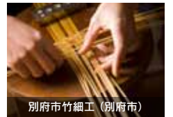
別府市竹細工 (別府市)