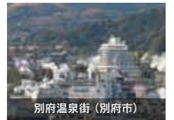
別府温泉街 (別府市)