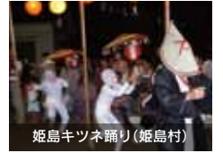
姫島キツネ踊り (姫島村)

大分県には全国的にも有名な別府・湯布院の温泉をはじめ、様々な観光地や特産品があります。ぜひ一度といわず何度でもお越しください。